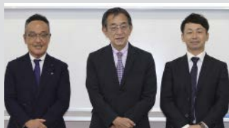
課題レポートの中間報告を終えてホッと一息の2年生