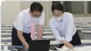
期末レポートの提出に向けて慌ただしく準備する1年生

経営学修士(MBA)コースの詳細や入学にかかるご相談などにつきましては、経済学研究科ホームページや問い合わせ窓口をご活用ください。